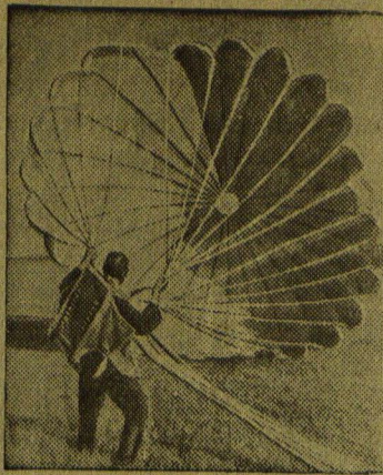
Воздушный спорт в СССР. На снимке: приземление парашютиста.